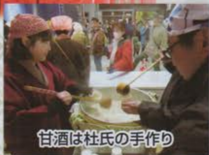
甘酒は杜氏の手作り