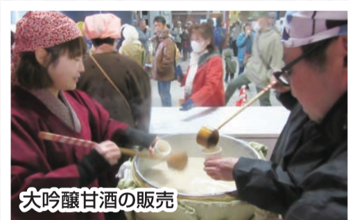
大吟醸甘酒の販売