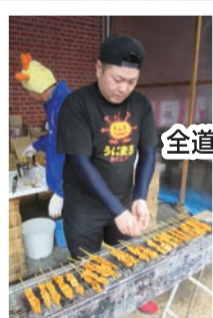
全道の美味しいもの大集合