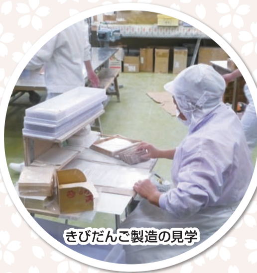
きびだんご製造の見学